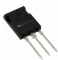
IXTR36P15P IXYS MOSFET P-CH 150V 22A ISOPLUS247