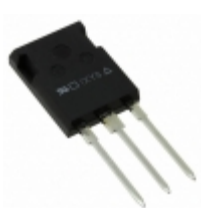
IXTR170P10P IXYS MOSFET P-CH 100V 108A ISOPLUS247