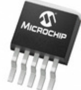
TC1267VETTR Microchip Technology IC REG LDO 3.3V 400MA PCI 5DDPAK