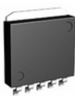
BD00D0AWHFP-TR Rohm Semiconductor IC REG LDO ADJ 2A HRP5