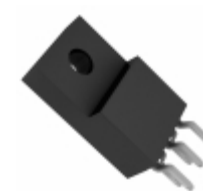
BD00C0AWCP-V5E2 Rohm Semiconductor IC REG LDO ADJ 1A TO220-5