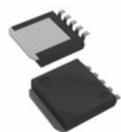
BD00C0AWHFP-CTR LAPIS Semiconductor IC REG LINEAR POS ADJ 1A HRP5