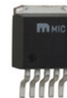
MIC29312WU Microchip Technology IC REG LDO ADJ 3A TO263-5