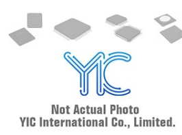
RT9064-33GVN RICHTEK RICHTEK SOT23