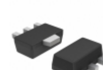
RT9064-33GX Richtek USA Inc. IC REG LDO 3.3V 0.2A