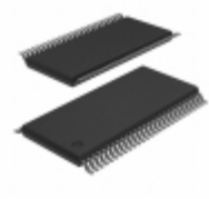
74ALVT16260DGG,112 NXP USA Inc. IC 12-24BIT MUX D LATCH 56TSSOP