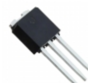
STPS8L30H STMicroelectronics DIODE SCHOTTKY 30V 8A IPAK