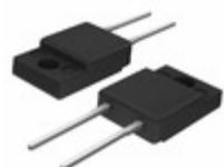
BY229X-200HE3/45 Electro-Films (EFI) / Vishay DIODE GEN PURP 200V 8A ITO220AC