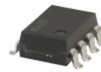
AQW614EA Panasonic RELAY OPTO DPST-NO/NC 8 SMD