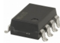
AQW614AZ Panasonic RELAY OPTO AC/DC 400V 100MA 8SMD