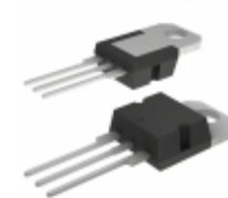
MIC29510-3.3BT Microchip Technology IC REG LDO 5A 3.3V TO220-3