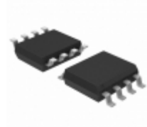
MIC2951-4.85BM-TR Microchip Technology IC REG LDO 4.85V/ADJ 0.15A 8SOIC