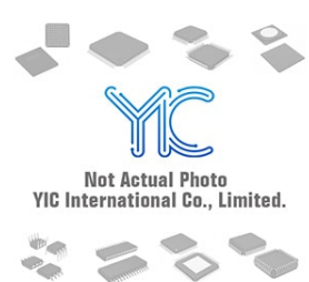
MIC5259-2.85YD5 TR MICREL MICREL SOT-153