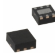
MIC5259-2.85BML-TR Microchip Technology IC REG LDO 2.85V 0.3A 6MLF