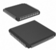
CY37064P84-200JXC Cypress Semiconductor Corp IC CPLD 64MC 6NS 84PLCC