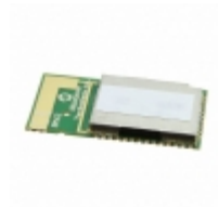
BM62SPKS1MC2-0001AA Microchip Technology RF TXRX MOD BLUETOOTH TRACE ANT