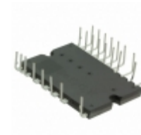
BM63764S-VC Rohm Semiconductor IC IPM 600V IGBT SW 25HSDIP