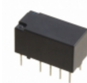
TX2-12V-TH Panasonic Electric Works RELAY GEN PURPOSE DPDT 2A 12V