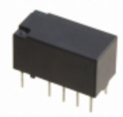
TX2-24V-TH Panasonic Electric Works RELAY GEN PURPOSE DPDT 2A 24V