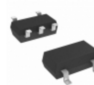
NC7S32P5X Fairchild/ON Semiconductor IC GATE OR 1CH 2-INP SC-70-5