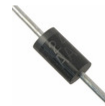
1N5820 Fairchild/ON Semiconductor DIODE SCHOTTKY 20V 3A DO201AD