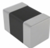
C0805L226M9PACTU KEMET CAP CER 22UF 6.3V X5R 0805