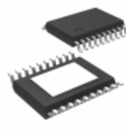
MIC2596-1BTSE-TR Microchip Technology IC SWITCH HOT SWAP DUAL 20-TSSOP