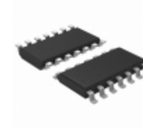
MIC2595R-2YM-TR Microchip Technology IC CTRLR HOT-SWAP 1CH NEG 14SOIC