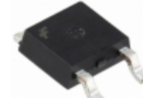
KA317MRTM Fairchild/ON Semiconductor IC REG LDO ADJ 0.5A TO252-3