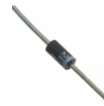
DSB5820 Microsemi Corporation DIODE SCHOTTKY 20V 3A DO204AH