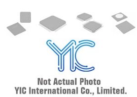
MB90F546GS QFP QFP FUJ