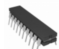
AD7820CQ Analog Devices Inc. IC ADC 8BIT HS TRACK/HOLD 20CDIP