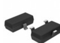
11AA161T-I/TT Microchip Technology IC EEPROM 16KBIT 100KHZ SOT23-3