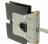
11AT20 Honeywell Sensing and Productivity Solutions SWITCH TOGGLE DPDT 15A 125V