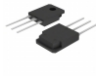
DPF60C200HJ IXYS DIODE RECT FAST 1.2KV 30A TO247