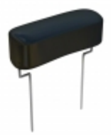
DPFF12D27J-F Cornell Dubilier Electronics (CDE) CAP FILM 2700PF 5% 1.2KVDC RAD