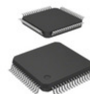
MC9S08AW32CPUER NXP Semiconductors / Freescale S08AW 8-BIT MCU S08 CORE 32KB