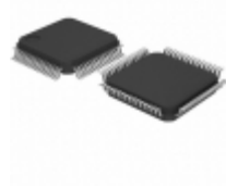
MC9S08AW48CFUE NXP USA Inc. IC MCU 8BIT 48KB FLASH 64QFP