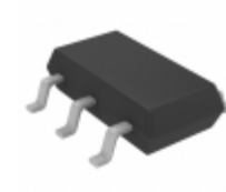
LTC3803HS6#TRPBF ADI (Analog Devices, Inc.) IC REG CTRLR FLYBACK TSOT23-6