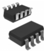
ZDT619TA Diodes Incorporated TRANS 2NPN 50V 2A SM8