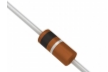
BZX55B4V3-TAP Electro-Films (EFI) / Vishay DIODE ZENER 4.3V 500MW DO35