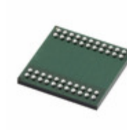
ADM3252EABCZ Analog Devices Inc. DGTL ISO 2.5KV 4CH RS232 44BGA