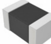
EZJ-S2VB223 Panasonic Electronic Components VARISTOR 12V 0805