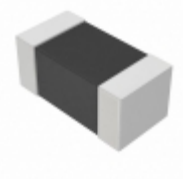
EZJ-S1VD182 Panasonic Electronic Components VARISTOR 50V 0603