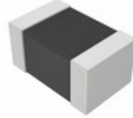
EZJ-S2YD472 Panasonic Electronic Components VARISTOR 50V 0805