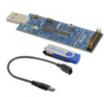
AT97SC3205P-SDK2 Micrel / Microchip Technology DEMO KIT FOR 97SC3204