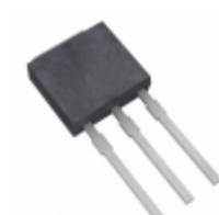
KSA1242OTU Fairchild/ON Semiconductor TRANS PNP 20V 5A I-PAK