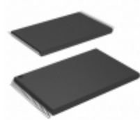
SST38VF6402-90-5C-EKE Microchip Technology IC FLASH 64MBIT 90NS 48TSOP