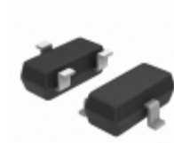
BZX84C47LT1 ON Semiconductor DIODE ZENER 47V 225MW SOT23-3