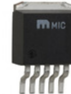
MIC5209YU Microchip Technology IC REG LDO ADJ 0.5A TO263-5