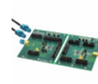
MAX9217EVKIT+ Maxim Integrated KIT PCB EVALUATION FOR MAX9217