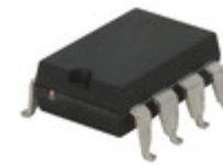
PAA127STR IXYS Integrated Circuits Division RELAY OPTOMOS 200MA SP-NO 8-SMD