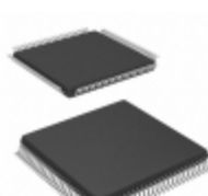
ATF1504ASV-15AI100 Microchip Technology IC CPLD 64MC 15NS 100TQFP