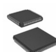
ATF1504ASL-25JI68 Microchip Technology IC CPLD 64MC 25NS 68PLCC