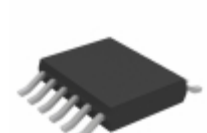
LTC6957HMS-3#TRPBF ADI (Analog Devices, Inc.) IC CLK BUFFER DVR 1:2 12MSOP