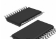
5V2310PGG IDT, Integrated Device Technology Inc IC CLK BUF 1:10 200MHZ 24TSSOP