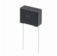
ECQ-UAAF224K Panasonic Electronic Components CAP FILM 0.22UF 10% 275VAC RAD