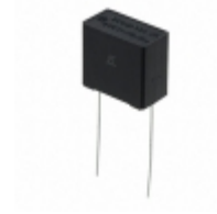
ECQ-UAAF334M Panasonic Electronic Components CAP FILM 0.33UF 20% 275VAC RAD