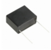
ECQ-UAAF225M Panasonic Electronic Components CAP FILM 2.2UF 20% 275VAC RADIAL