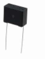
ECQ-UAAF224M Panasonic Electronic Components CAP FILM 0.22UF 20% 275VAC RAD