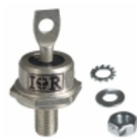
30HFU-300 Electro-Films (EFI) / Vishay DIODE GEN PURP 300V 30A DO203AB