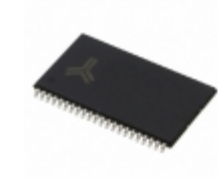
AS6C4016A-55ZIN Alliance Memory, Inc. IC SRAM 4MBIT 55NS 44TSOP