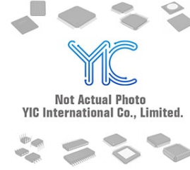
DAP222M ROHM DAP222M ROHM