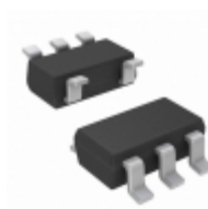
TC2055-2.85VCTTR Microchip Technology IC REG LDO 2.85V 0.1A SOT23-5