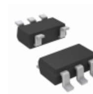
TC2055-2.7VCTTR Microchip Technology IC REG LDO 2.7V 0.1A SOT23-5