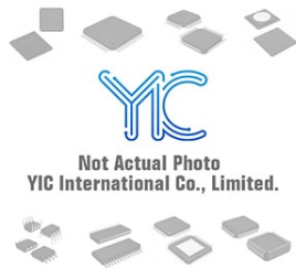
BYM358DX PH BYM358DX PH