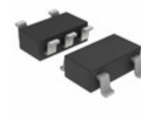
NCP100SNT1G ON Semiconductor IC VREF SHUNT ADJ 5TSOP