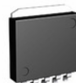
BA33DD0WHFP-TR Rohm Semiconductor IC REG LDO 3.3V 2A HRP5