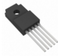
BA33DD0WT Rohm Semiconductor IC REG LDO 3.3V 2A TO220FP