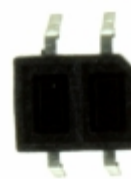
GP2S24BCJ00F Sharp Microelectronics PHOTOINTERRUPTER TRANS OUT 4X3