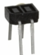
GP2S24BJ000F Sharp Microelectronics PHOTOINTERRUPTER REFL 0.7MM PCB