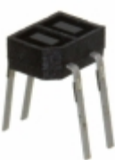
GP2S24CJ000F Sharp Microelectronics PHOTOINTERRUPTER REFL 0.7MM PCB