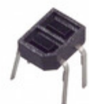
GP2S24J0000F Sharp Microelectronics PHOTOINTERRUPTER TRANS OUT 4X3