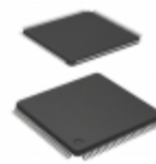
MC9S12XDT512MAL NXP USA Inc. IC MCU 16BIT 512KB FLASH 112LQFP