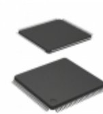
MC9S12XEG128MAL NXP USA Inc. IC MCU 16BIT 128KB FLASH 112LQFP