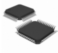
USB2502-HT Microchip Technology IC CONTROLLER USB 48TQFP