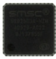
USB2503A-HZH Microchip Technology IC HUB 3PORT USB COMPATBL 48-QFN